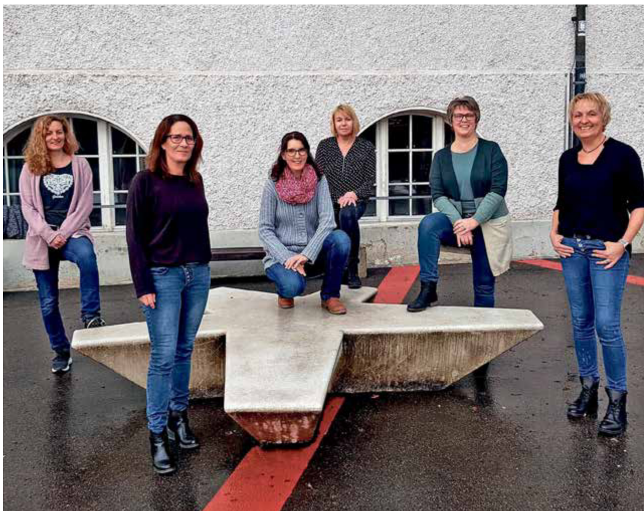
Das Team der Tagesstrukturen.

Nachmittagsbetreuung von 13.30–18.00 Uhr 2–8 Kinder