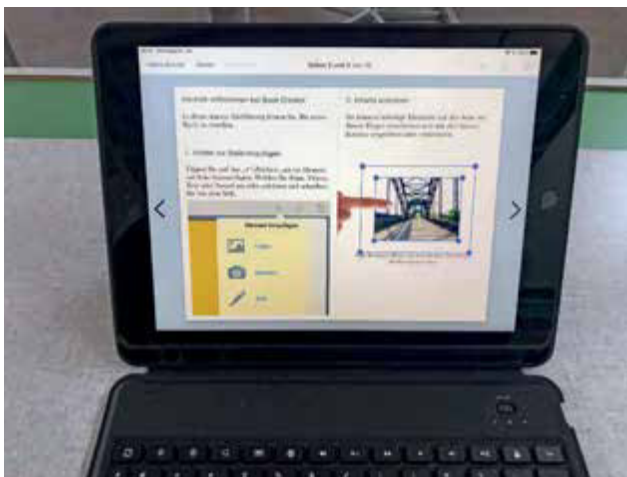
Neue Möglichkeiten dank der neuen iPads, wie zum Beispiel das Online-Gestalten eines Buches.