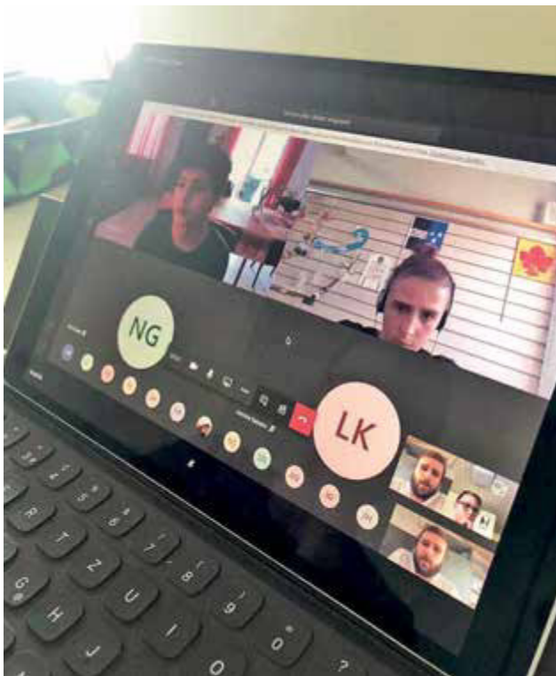
Unterricht am Bildschirm: Bereits im Frühling 2020 hatte wegen des Coronavirus für einige Wochen auf Fernunterricht umgestellt werden müssen.

In Kaisten nutzen die Lehrpersonen schon seit einigen Jahren MacBooks und iPads für ihre Arbeit und ihren Unterricht. Diese digitalen Medien haben schon punktuell Einzug im Unterricht gehalten, als es noch keinen expliziten Auftrag dafür im Lehrplan gab. Hier schon Vorarbeit geleistet zu haben, kam